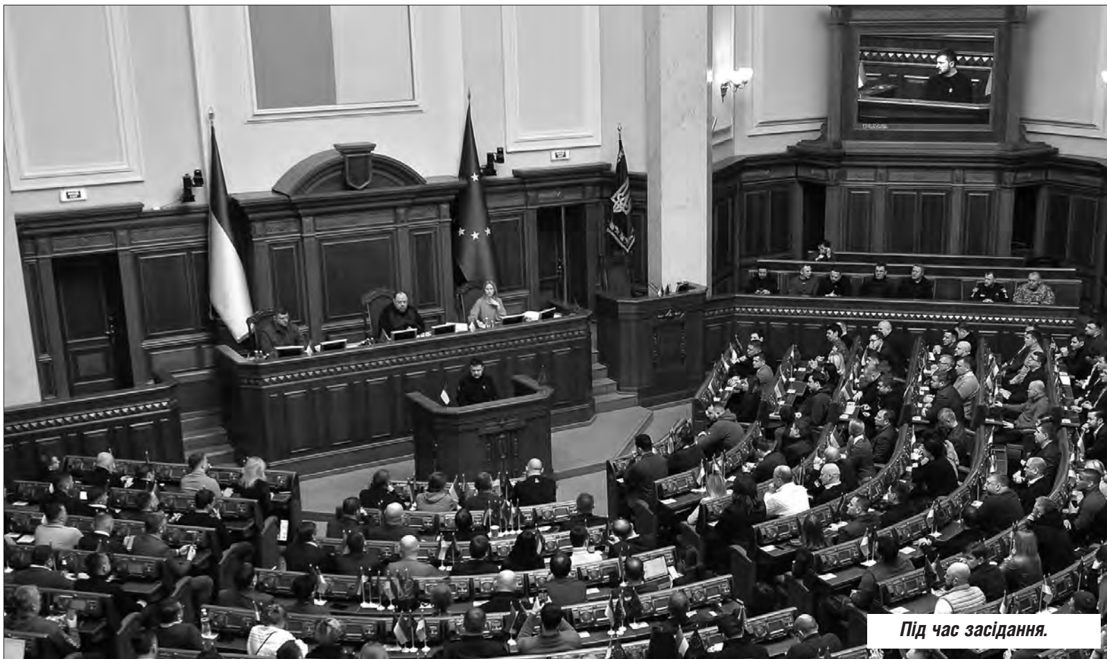
Більше фото тут — www.golos.com.ua